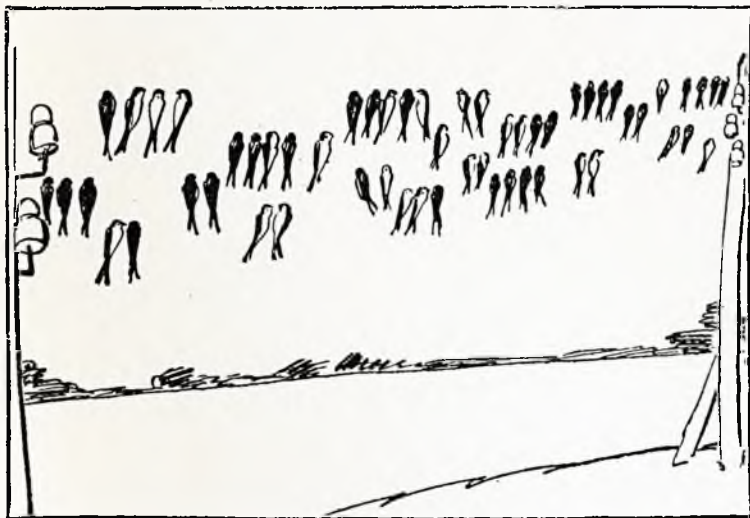
Romanticismo dopo Marconi.